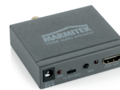
1x HDMI audio extractor