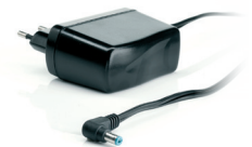
1x Energy saving switched mode power supply