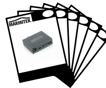
1x Quick installation manual English, Deutsch, Français, Español, Italiano, Nederlands.